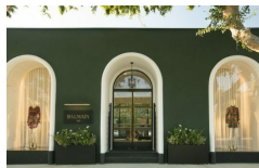
Balmain sbarca ad Hollywood 2 agosto 2017