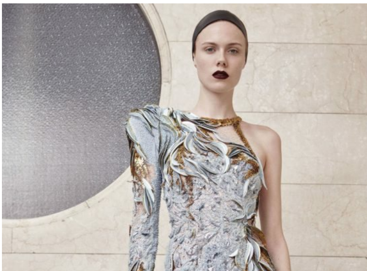
Una creazione Atelier Versace autunno-inverno 2017/2018

Qual è il luogo più segreto di una Maison? Senza dubbio, il suo atelier . 12 fashion houses aprono le porte dei loro laboratori al pubblico: ecco tutti i dettagli di ApritiModa , una manifestazione davvero unica (e gratuita) in arrivo a Milano.