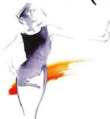
* CLARA BONA © RIPRODUZIONE RISERVATA

VISITE GUIDATE A 14 GRANDI MAISON CHE PER UN WEEKEND APRONO AL PUBBLICO LE PORTE DEI LORO ATELIER