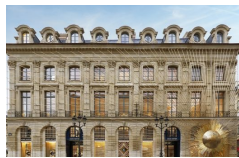
Louis Vuitton torna à la Maison 4 ottobre 2017