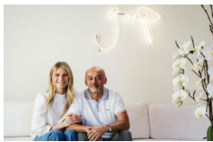
Goop x Christian Louboutin: la nuova capsule disegnata da Gwyneth Paltrow 19 settembre 2017