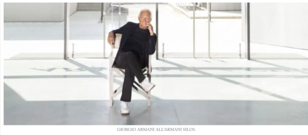
GIORGIO ARMANI ALL'ARMANI SILOS

Diario di un'alimentazione sana nei lockdown -2