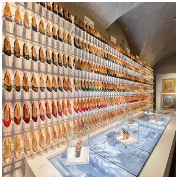
IL MUSEO DI SALVATORE FERRAGAMO A FIRENZE, TOSCANA.

La manifestazione ha l'obiettivo di far conoscere al pubblico dove nascono le creazioni che rendono l'Italia famosa in tutto il mondo. Tutti gli eventi dell'edizione ApritiModa 2020 sono visitabili gratuitamente previa prenotazione in quanto sono a numero chiuso.